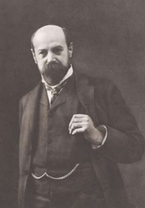
Alfred Messel, Fotografie um 1907