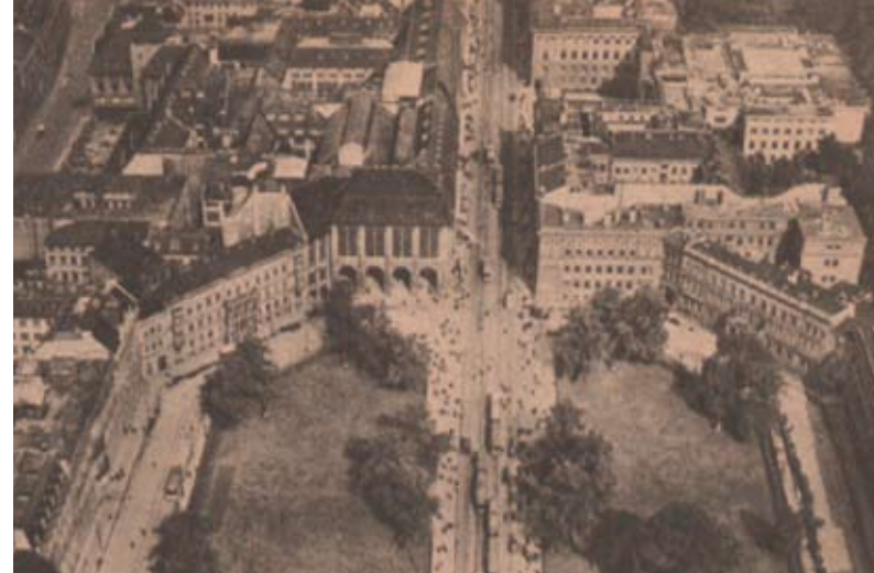
Warenhaus Wertheim, Postkarte um 1920